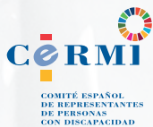
Comité Español de Representantes de Personas con Discapacidad (CERMI)