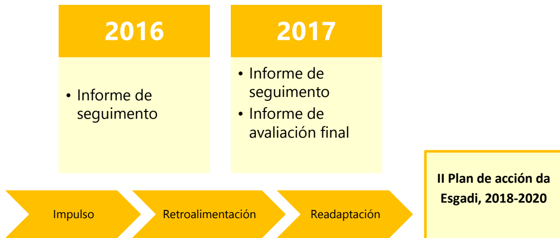
Figura 1. Seguimento e avaliación do I Plan de acción da Esgadi, 2016-2017.

O presente documento inclúe un anexo no que se expoñen os indicadores de realización propostos para cada obxectivo operativo 6 , o que orientará o seguimento continuado que deberán levar a cabo todos os organismos responsables das